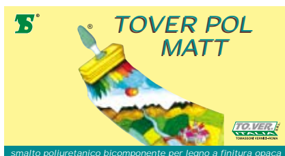
smalto poliuretano bicomponente per legno a finitura opaca

Confezioni di vendita: Lt. 0,750 - 2,5 - 16