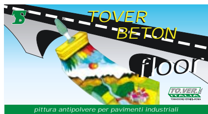
pittura antipolvere per pavimenti industriali

Colori: vedi cartella. Confezioni di vendita: Lt. 2,5 - 5 - 15