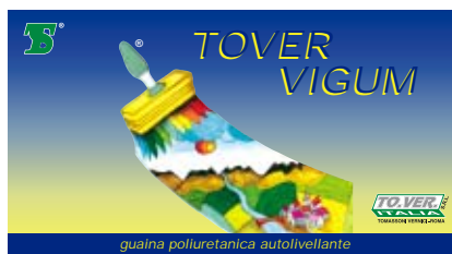
guaina poliuretanica autolivellante

Colori: vedi cartella. Confezioni di vendita: Lt. 5 - 15