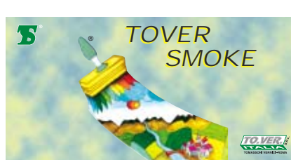
pittura murale supercoprente a solvente inodore per interni

Pittura murale a solvente inodore super coprente, ideale contro la nicotina e il fumo, per interni a finitura opaca.