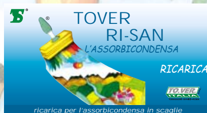
ricarica per l'assorbicondensa in scaglie

Confezioni di vendita: Lt. 0,750 - 2,5 - 16