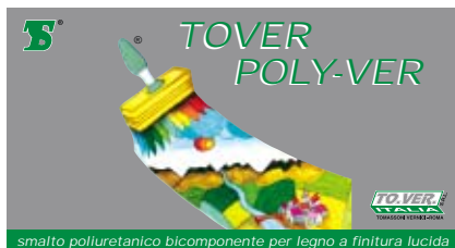
smalto poliuretano bicomponente per legno a finitura lucida

Pittura poliuretana per calcestruzzo e muratura, indicata per protezione dalle aggressioni atmosferiche.