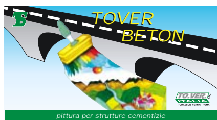
pittura per strutture cementizie

È uno speciale protettivo impermeabile per calcestruzzo ad effetto coprente. Costituisce una barriera contro gli attacchi degli acidi dell'atmosfera inquinata.