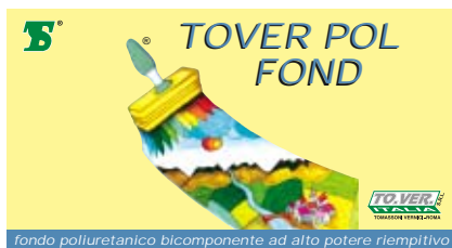
fondo poliuretano bicomponente ad alto potere riempitivo

Confezioni di vendita: Lt. 0,750 - 2,5 - 15