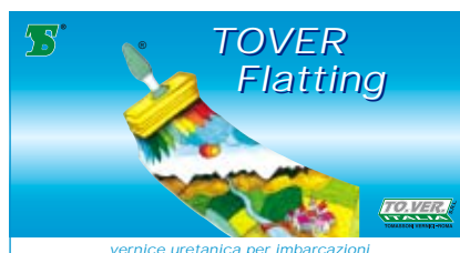
vernice uretanica per imbarcazioni