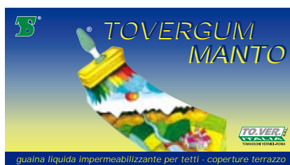
guaina liquida impermeabilizzante per tetti - coperture terrazzo

Colori: vedi cartella. Confezioni di vendita: Lt. 5 - 15