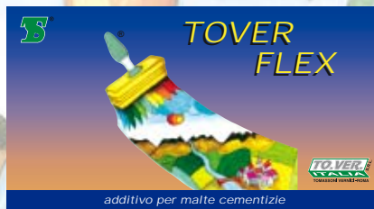
additivo per malte cementizie

Colori: rosso, grigio, marrone, verde. Confezioni di vendita: Lt. 15