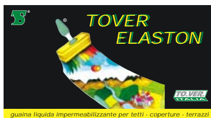
guaina liquida impermeabilizzante per tetti - coperture - terrazzi

Colori: blu, bianco, giallo. A richiesta anche rifrangenti. Confezioni di vendita: Kg. 5 - 30