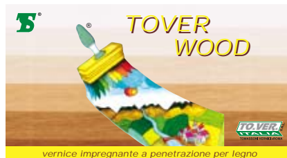
vernice impregnante a penetrazione per legno

Vernice impregnante protettiva per legno naturale, penetra profondamente nei pori del legno esaltandone le venature.