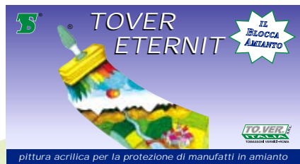
pittura acrilica per la protezione di manufatti in amianto

Colori: grigio. Confezioni di vendita: Kg. 6 - 18