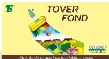
nitro, fondo turapori carteggiabile a secco

Nitro, fondo turapori carteggiabile a secco. Garantisce una perfetta uniformità di assorbimento del legno. Consigliato nel ciclo di verniciatura con finiture nitrosintetiche.