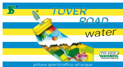
pittura spartitraffico all'acqua

Colori: vedi cartella Confezioni di vendita: Kg. 3 - 6 - 18