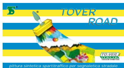
pittura sintetica spartitraffico per segnaletica stradale

Colori: rosso, grigio, verde. Confezioni di vendita: Kg. 6 - 18