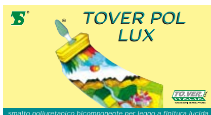
smalto poliuretano bicomponente per legno a finitura lucida

Confezioni di vendita: Lt. 0,750 - 2,5 - 16.