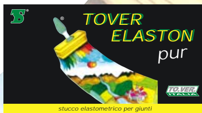
stucco elastometrico per giunti

Colori: bianco, giallo, blu. Confezioni di vendita: Kg. 5 - 30